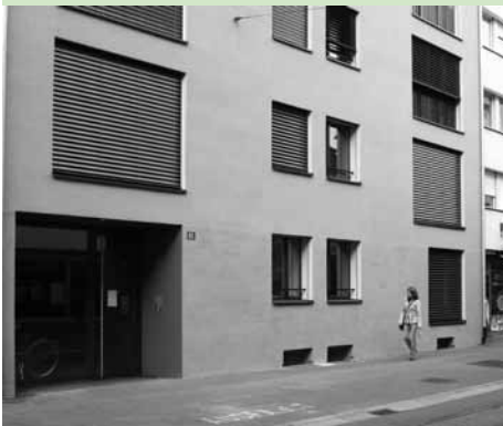
Das Gebäude an der Güterstrasse 83.

Die Grünen Baselland und Basel-Stadt legen ihre Büros in Basel zusammen. Mit dieser Pioniertat setzen sie symbolisch um, was ihnen ein zentrales politisches Anliegen ist: Die bessere und engere Zusammenarbeit zwischen Land und Stadt in unserer Region.