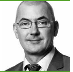
Isaac Reber, Regierungsrat und Vorsteher der Sicherheitsdirektion