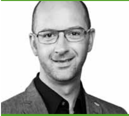
Philipp Schoch, Präsident Grüne Baselland